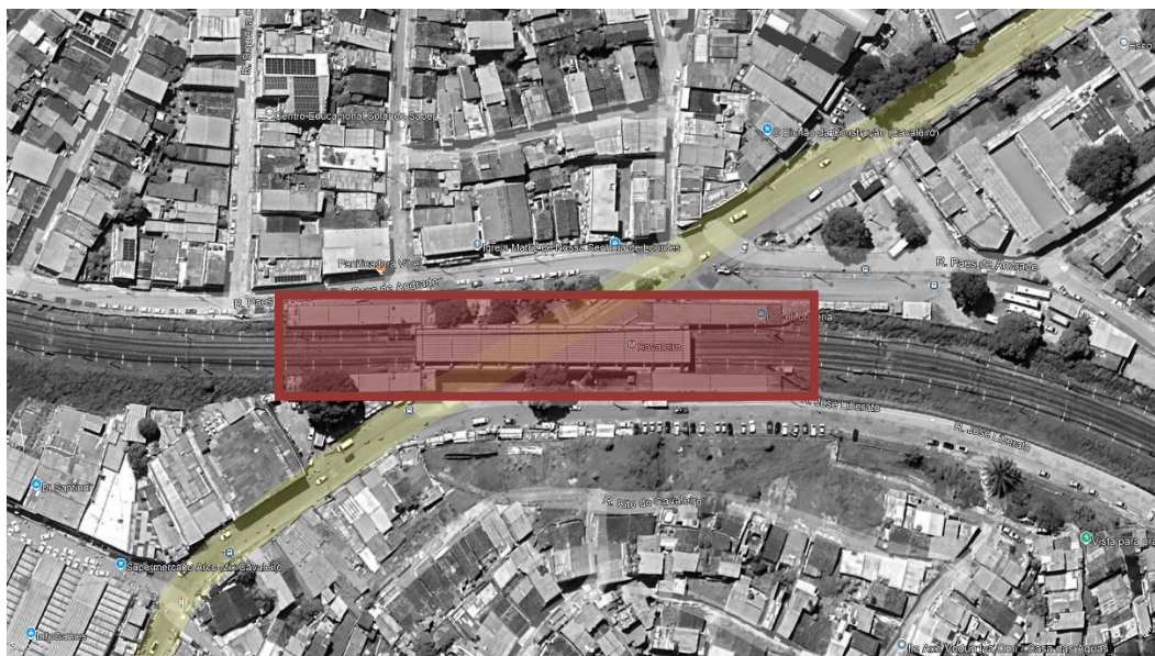
FIGURA 1 – ESTAÇÃO CAVALEIRO (Fonte: Google Earth 2024)